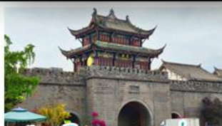
เมืองโบราณกวนเซี่ยน

ภูเขาสี่ดรุณี - อุทยานป่ฝิ่งโกว - สะพานหนานเฉียว - ร้านหนังสือจงซูเก้อ - เมืองโบราณกวนเสียน จตุรัสหยางเทียนหวู่ - หิมะแพนด้าเซลฟี - ถนนโบราณชอยกว้างชอยแคบ - ถนนคนเดินไท่กู่หลี่ ถนนคนเดินซุนซี - ถนนโบราณจิ่นหลี่ - แพนด้ายักษ์ปิงตึก - น้ำพุไม้ไผ่ตึกSKP - วัดต้าเจี๋ย