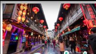
ถนนโบราณจิ่นหลี่