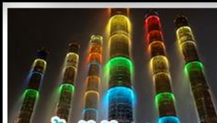
น้ำพุไม้ไผ่ตึกSKP