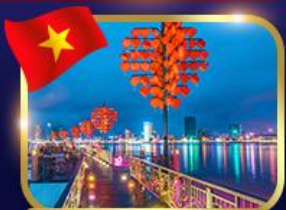
สะพานแห่งความรัก ดานัง