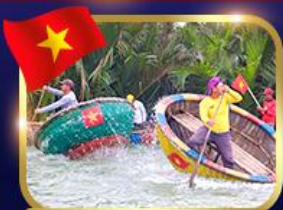
ล่องเรือกระดิว หมู่บ้านกัทาน