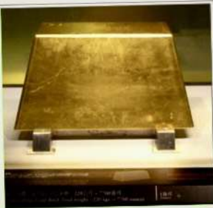
พิพิธภัณฑ์ทองคำ