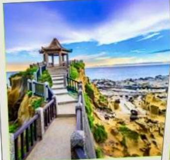
อุทยานเกาะเหอผิง