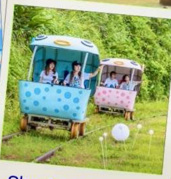
Shen'ao Rail Bike