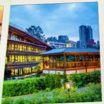
ห้องสมุดเป่ย์โถว