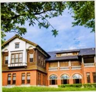
พิพิธภัณฑ์น้ำพุร้อนเป่ย์โถว