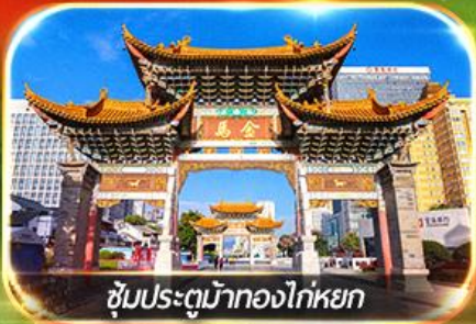
ซุ้มประตูม้าทองไก่อหยก