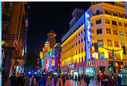
ถนนคนเดินหนานจิงลุ่