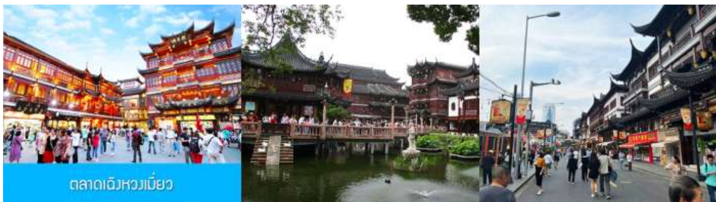
ตลาดเจิงหวงเมี่ยว

เช้า รับประทานอาหารเช้า ณ ห้องอาหารของโรงแรม (6)