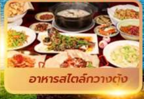
อาหารสไตล์กวางตุ้ง