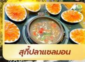
สุกี้ปลาแซลมอน