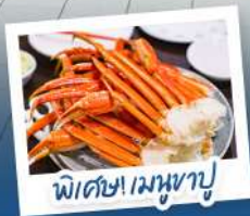
พิเศษ! เมฆหุบ