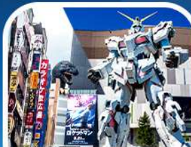
ช้อปปิ้งชินจูกุ+กันดั้มยักษ์