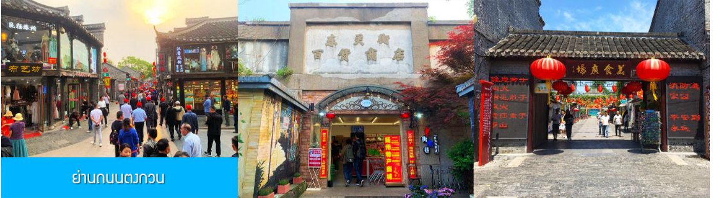
ย่านถนนตงกวน

ชม จัตุรัสชิงไห่ 星海广场 เป็นจัตุรัสขนาดใหญ่เป็นแลนด์มาร์คสำคัญของเมืองต้าเหลียน สร้างขึ้นเพื่อเฉลิมฉลองในโอกาสที่รัฐบาลอังกฤษคืนเกาะฮ่องกงในให้จีนในปี ค.ศ. 1997 ตั้งอยู่ชายฝั่งทะเลในเมืองต้าเหลียน เป็นจัตุรัสใจกลางเมืองที่ใหญ่ที่สุดในโลกและ เป็นแลนด์มาร์คของเมืองต้าเหลียน รายล้อมด้วยตึกระฟ้าที่ทันสมัย ภายในมีบ่อน้ำพุดนตรี ลานหญ้าขนาดใหญ่ และลานกว้างสำหรับจัดกิจกรรมกลางแจ้ง อาทิ เทศกาลเบียร์นานาชาติ การแข่งขันวิ่งมาราธอน งานแฟชั่นนานาชาติเมืองต้าเหลียน ฯลฯ