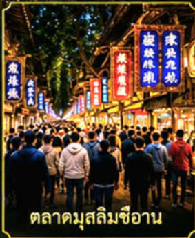
ตลาดมุสลิมซีอาน