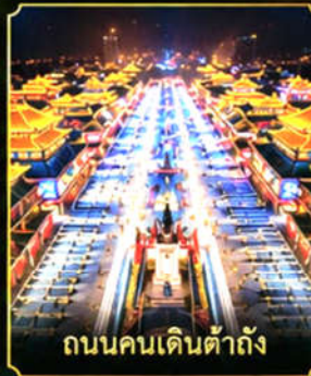
ถนนคนเดินต้าถัง