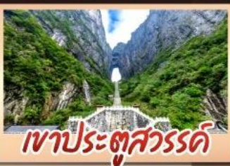
เขาประตูลั่ว