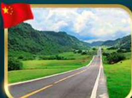
ชมวิวยุทยานฆานางฟ้า