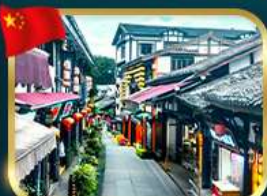
หมู่บ้านโบราณฉือซีโซ่ว

เที่ยวอุทยานหลุมฟ้าสะพานสวรรค์ + ฆานางฟ้า