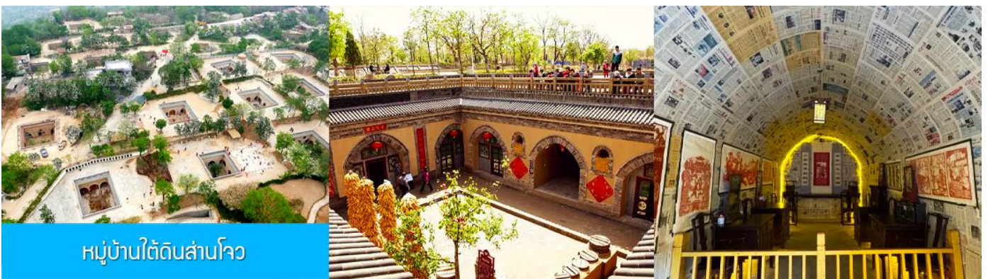
หมู่บ้านใต้ดินสามโจว

หลังอาหารนำท่านเดินทางสู่ เมืองซานเหมินเกีย 三门峡 (ระยะทาง 149 กม ใช้เวลาเดินทางราว 2 ชั่วโมง)