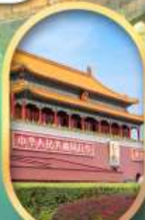
จัสมุขเทียนอันเหมิน