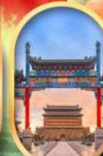
ถนนคนเดินเทียนเหมิน