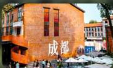
ดงเจียวจี้

HOLIDAY INN EXPRESS HOTEL หรือเทียบเท่า 4 คาว