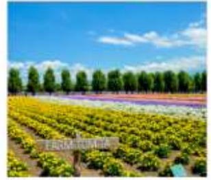
ทุ่งลาเวนเดอร์โทมิตะ