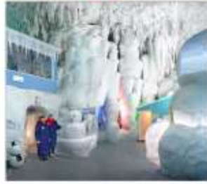
พิพิธภัณฑน์น้ำแข็ง