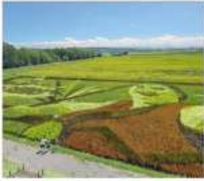
ศิลปะบนทุ่งนา