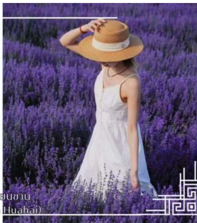
ทุ่งดอกไม้เทียนซาน (Yili Tianshan Huahai)

จากนั้นนำท่านสู่เมืองนาราลี (ใช้เวลาเดินทางประมาณ 3 ชั่วโมง)