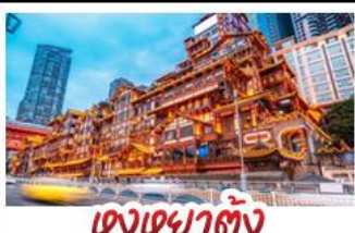
เฉิงเฉิงเฉิง

อุทยานหลุมบ่อฟ้า - อุทยานเขานางฟ้า หงหยาดัง - นั่งรถไฟทะเลสาบ - อุทยานสี่ดรุณี ปี้เฉิงโกว - สะพานหนานเฉียว