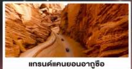
แกรนด์แคนยอนอาถูซือ