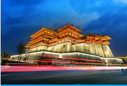
นครลั่วหยาง