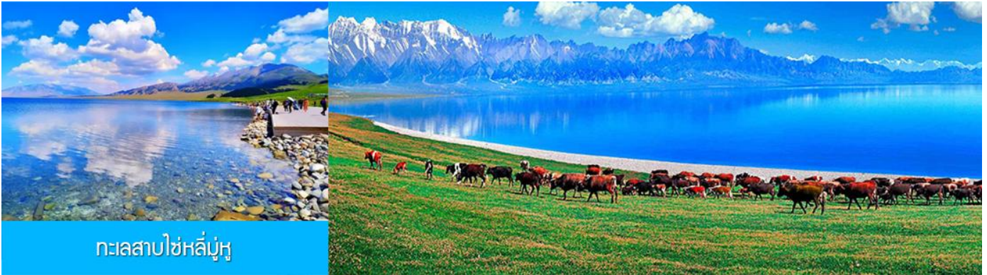
ทะเลสาบไซหลี่มู่หู

พักที่ XIHAI LIJING HOTEL ระดับ 4 ดาวท้องถิ่นหรือเทียบเท่าในเมืองปัวเล่