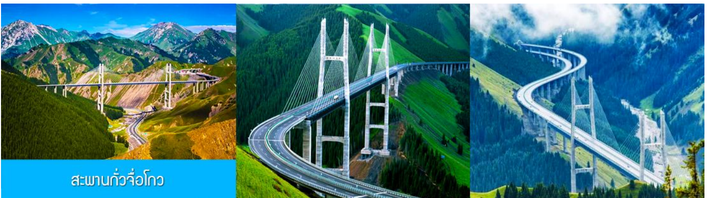
สะพานกั๋วจื่อโกว

หลังอาหารนำท่านเดินทางโดยรถบัสสู่ ตำบลนำลาตี 那拉提 (ระยะทาง 300 กม. ใช้เวลาเดินทางราว 4 ชั่วโมง)