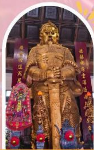
วัดแชกง ขอพรโชคลาก การเงิน และธุรกิจ