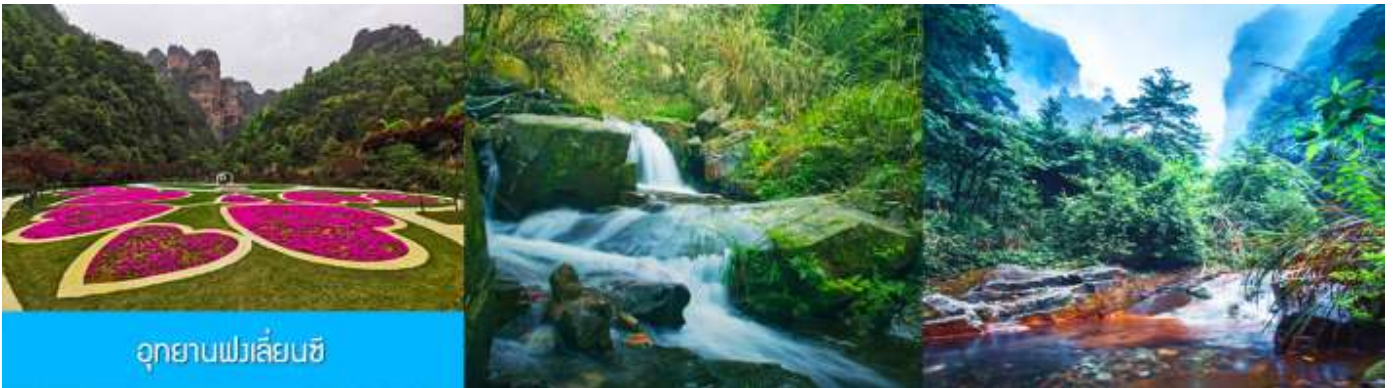
อุทยานฟงเลียนซี