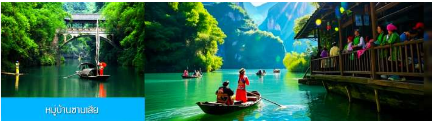
หมู่บ้านชาวนเลีย

พักที่ YICHANG HUIHAO HOTEL โรงแรมระดับ 4 ดาวหรือเทียบเท่าในเมืองหยี่ชาง