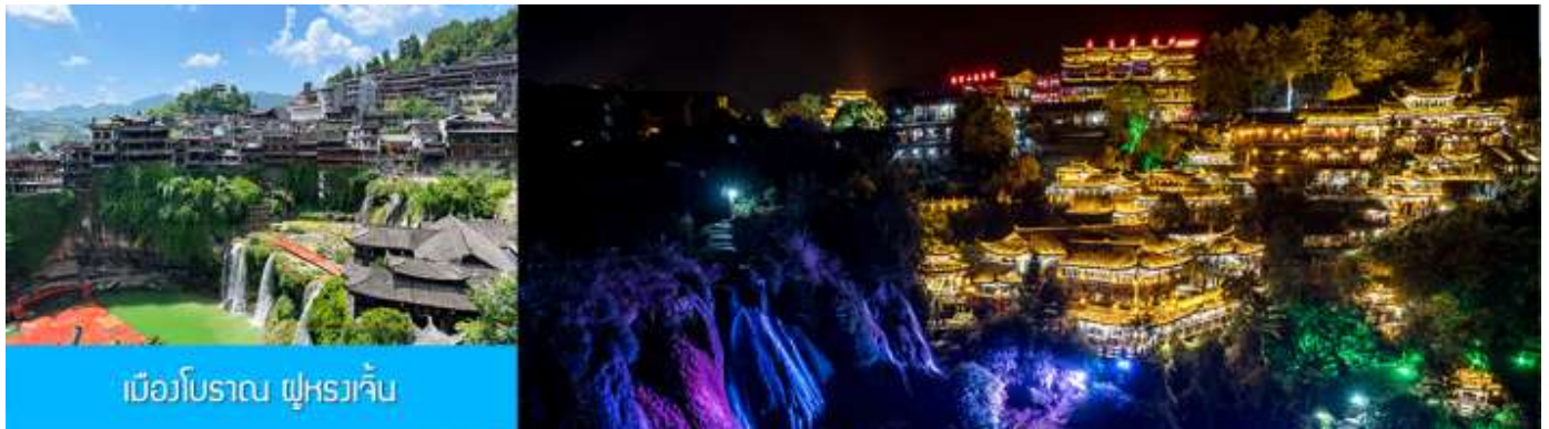
เมืองโบราณ ฝูหรงเจิน

จากนั้นนำท่านเดินทางสู่เมืองฝูหรงเจิน นำท่านเที่ยวชม เมืองโบราณ ฝูหรงเจิน 芙蓉古镇 เมืองโบราณเก่าแก่ขึ้นชื่อของมณฑลหูหนานที่โด่งดังจาก ภาพยนตร์เรื่อง ฝูหรงเจิน เป็นสถานที่ท่องเที่ยวระดับ 4A ที่ได้รับความนิยมจากนักท่องเที่ยวคู่กับเมืองโบราณฟงหวง เป็นสถานที่หลักในการถ่ายทำภาพยนตร์เรื่อง ฝูหรงเจิน ทำให้สถานที่แห่งนี้ยังได้รับความนิยมจากนักท่องเที่ยว จุดไฮไลท์ของเมืองโบราณแห่งนี้ นอกจากบ้านเรือนโบราณสวยเก๋ที่เป็นเอกลักษณ์เฉพาะของมณฑลหูหนาน ที่นี่ยังมีน้ำตกขนาดใหญ่ที่สวยงามกลางเมืองที่เป็นจุดเช็คอิน