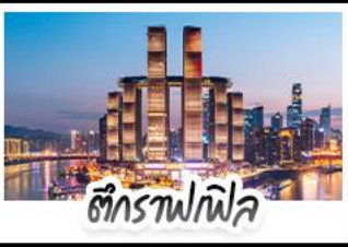
ตึกรูปไฟล