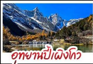
อุทยานป่าเขื่อนกั้น

อุทยานสี่ฤดู - อุทยานป่าเขื่อนกั้น - อุทยานจิวจ้ายโกว รถไฟความเร็วสูง - EASTERN SUBURB MEMORY ถนนโบราณความจำ - วัดต้าฉือ ช้อปปิ้งย่านคัง ถนนไต้กู่หลี่ + ถนนซุนซีลู่