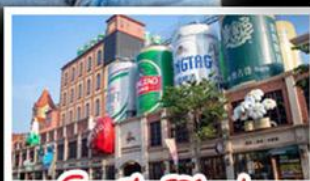
โรงแรมเป่ย์ริ่งชิงเต่า