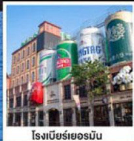
โรงเบียร์เยอรมัน