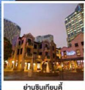
ย่านซินเทียนตี้