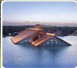
พิพิธภัณฑ์ไต้หน้ำกวงฟู่หลิน