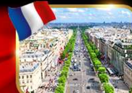
เดินเล่นย่านช็องเซลีเซ่