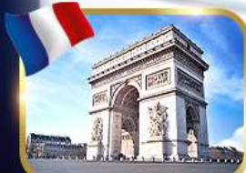
ประตูชัยอาร์กเดอทรียัมป์