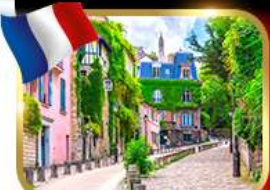
Rue de l'Abreuvoir มงมาร์ต