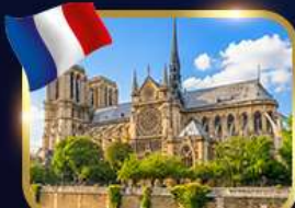
มหาวิหารนอร์เทอ์ดาม