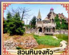
สวนหินงิ้วหวู่