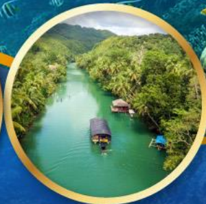
ล่องเรือแม่น้ำโลบ็อก