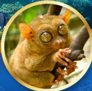
ลิงทาร์เซีย