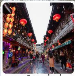
ถนนโบราณจีนหลี