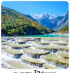
ทะเลสาบโป๋สุ่ยเหอ