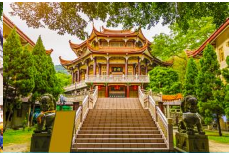
วัดหนานกั๋วซื่อ