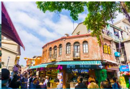
ถนนคนเดินหัวมังกร