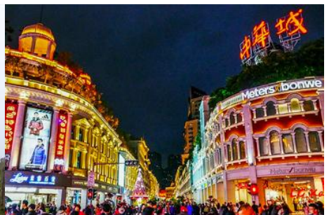
ถนนคนเดิน จวซาลู่