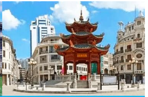
ย่านเมืองเก่าซัวเถา