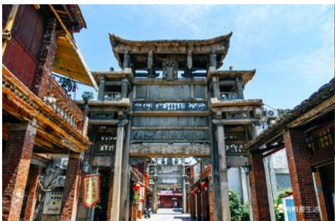
ถนนโบราณหมิงชิงแห่งเมืองจางโจว