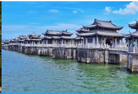
สะพานเซียงจื่อเจียว