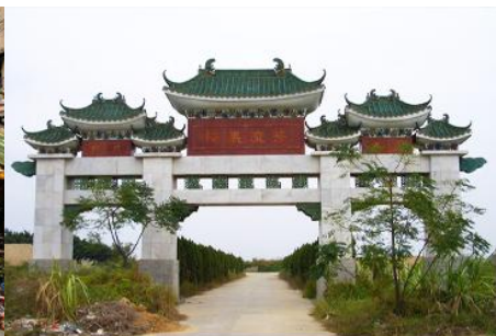
สุสานพระเจ้าตากสิน