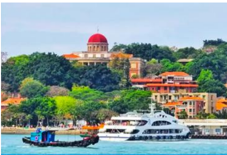
เกาะกู่ลิ่งหยี่

พักที่ โรงแรม XIAMEN HENGLONG HOTEL 4* หรือเทียบเท่าในเซี่ยเหมิน