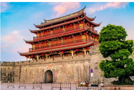
เมืองโบราณเต้จิ๋ว

พักที่ โรงแรม HAKKA TULOU PRINCE HOTEL 4* หรือเทียบเท่าในเมืองหย่งตั้ง