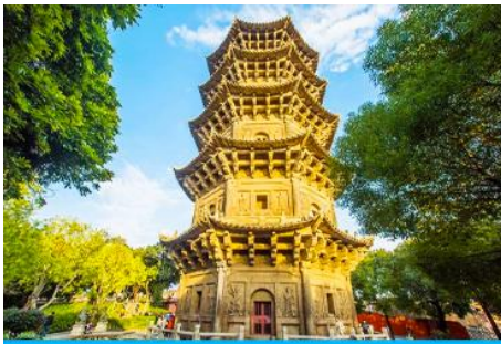
วัดโคหยวน