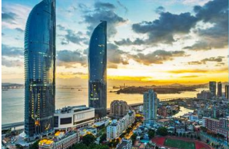
นครซีเยเหมิน

23.30 น. คณะเดินทางพร้อมกันที่ ท่าอากาศยานสุวรรณภูมิ อาคารผู้โดยสารขาออกชั้น 4 ประตูหมายเลข 10 เคาน์เตอร์ เช็คอิน สายการบิน XIAMEN AIRLINES (MF) เจ้าหน้าที่บริษัทฯ คอยให้การต้อนรับและอำนวยความสะดวกในการเช็คอิน