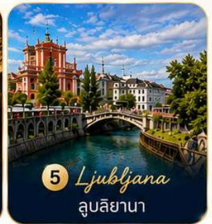
5 Ljubljana ลูบลิยานา