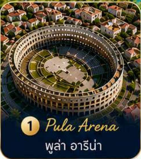
1 Pula Arena ปูลา อารีนา