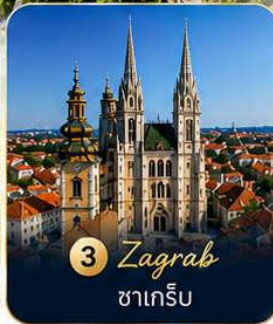
3 Zagreb ซาเกร็บ