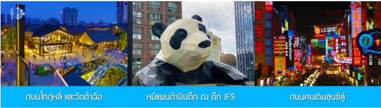
ถนนไท่กู่หลี่ และวัดต้าฉือ

พักที่ โรงแรม MULIAN ZHUANG HOTEL ระดับ 4 ดาวท้องถิ่น หรือเทียบเท่าในเมืองตู