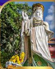
เจ้าแม่กวนอิม ริพลีสเบย์