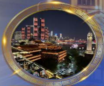
มือคำร้านอาหารวิวหลักล้าน