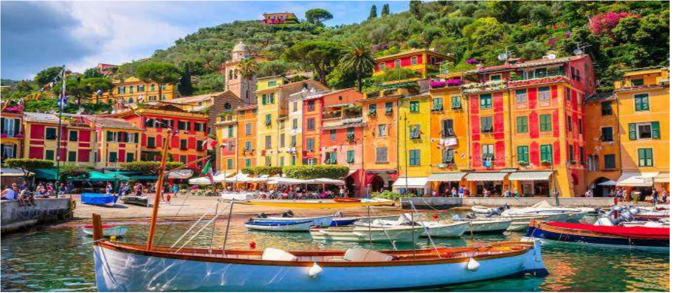
กลางวัน รับประทานอาหารกลางวัน ณ ภัตตาคาร

บ่าย อิสระให้ท่านเดินเล่น ถ่ายรูปและช้อปปิ้ง ตามอัธยาศัย แหล่งช้อปปิ้งสุดหรู เต็มไปด้วยร้านบูติกสุดหรูจากแบรนด์ดีไซเนอร์มากมาย อาทิ บาเลนเซียกา หลุยส์ วิตตอง และเฟร์รารากาโม โรเล็กซ์ และอื่นๆ ซึ่งเรียงรายอยู่ตามตรอกซอกซอยปูหินกรวดอันงดงามในย่านท่าเรืออันมีเสน่ห์ของเมือง ท่านสามารถเดินเล่นไปตามถนนแคบๆ ที่ปูหินกรวดเพื่อค้นพบแบรนด์ดีไซเนอร์ระดับไฮเอนด์ที่คัดสรรมาอย่างดี สินค้าเครื่องหนังและเครื่องประดับ สำรวจร้านค้าที่เชี่ยวชาญด้านเครื่องหนังชั้นเยี่ยมและเครื่องประดับสุดหรูอื่นๆ อิสระให้ท่านได้เลือกซื้อสินค้าได้ตามอัธยาศัย ได้เวลาอันสมควร นำท่านเดินทางสู่ เมืองปิอาเซนซ่า (Piacenza) (ระยะทาง 199 กม. ใช้เวลาเดินทาง 2.30 ชม.) เป็นเมืองทางประวัติศาสตร์ในแคว้นเอมีเลีย-โรมัญญา ประเทศอิตาลี ที่เหมาะแก่การเที่ยวชมสถาปัตยกรรมโรมันเนสก์และยุคกลาง เช่น วิหารและโบสถ์หลายแห่ง, พระราชวังฟาร์เนเซ (Palazzo Farnese) ซึ่งปัจจุบันเป็นพิพิธภัณฑ์