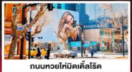
ถนนหยอยโหม่ดิลล์โรด