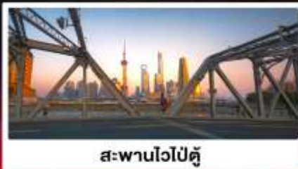
สะพานไวปี้ตู่