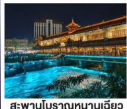
สะพานโบราณหนานเฉียว