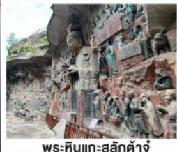
พระหินแกะสลักคำจู้