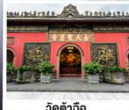
วัดคำฉื่อ