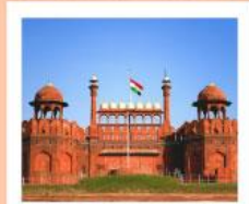
♥♥♥ Agra Fort