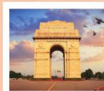
♥♥♥ India Gate