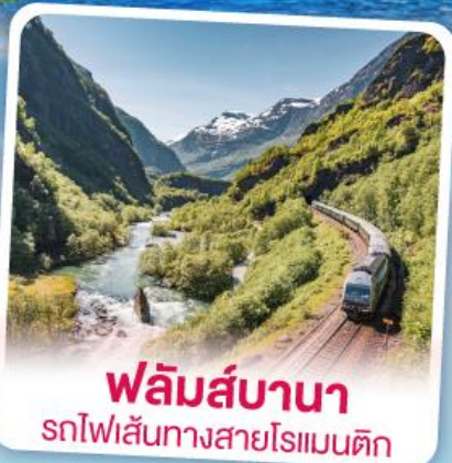
พลัมส์บานา รถไฟเส้นทางสายโรแมนติก