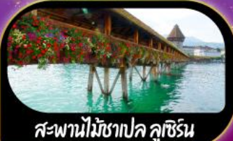
สะพานไม้ฆาปค ลูซิริน