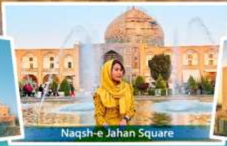
Naqsh-e Jahan Square